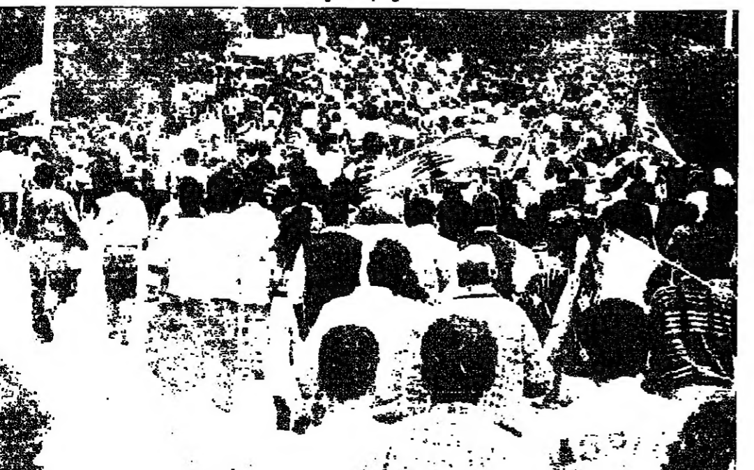
على طريق القصر